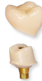
Faux-moignon pour prothèse scellée